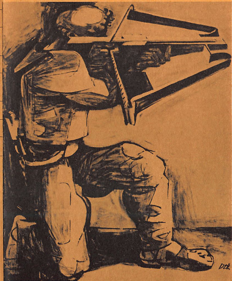
Wilhelm Tell von Friedrich Schiller Künstlerische Leitung: Erwin Kohlund