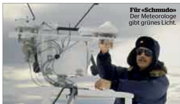
Für «Schmudo» Der Meteorologe gibt grünes Licht.

Massage zum Entspannen Gönnen Sie sich jetzt eine Auszeit bei einer klassischen Ganzkörpermassage während 60 Minuten in der Praxisgemeinschaft Luzern. Erhältlich unter www.blick.ch/deideal