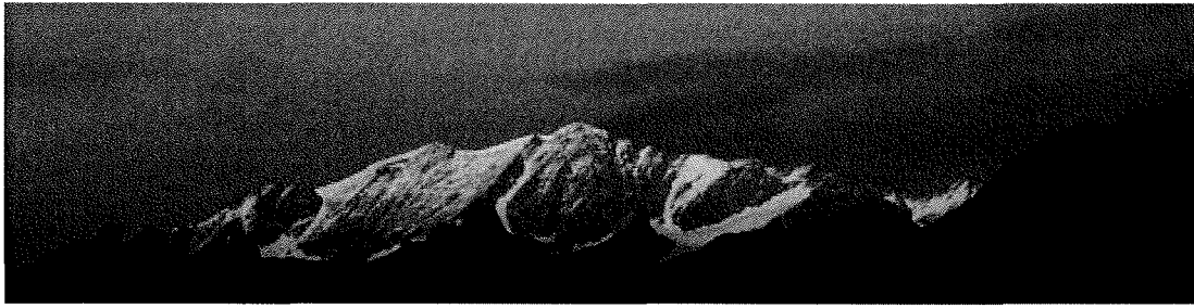
Alpenglüh im Engadin