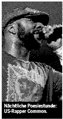
Nächtliche Poesiestunde: US-Rapper Common.

Zuvor gab Sektion Kuchikächthli ihr Comeback und spielte zum ersten Mal aus ihrem mit viel Funk gepfefferten Album «Affatanz». Für den kreativen frankofonen Part – neben dem obligaten Stress – sorgten IAM aus Marseille mit ihrem melodiosen und dennoch pumpenden Hip-Hop.